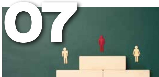
REGOLAMENTO DIARIE E SUSSIDI