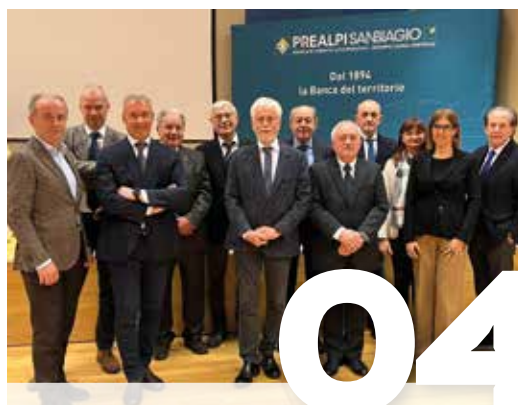
SALUTO DEL CDA